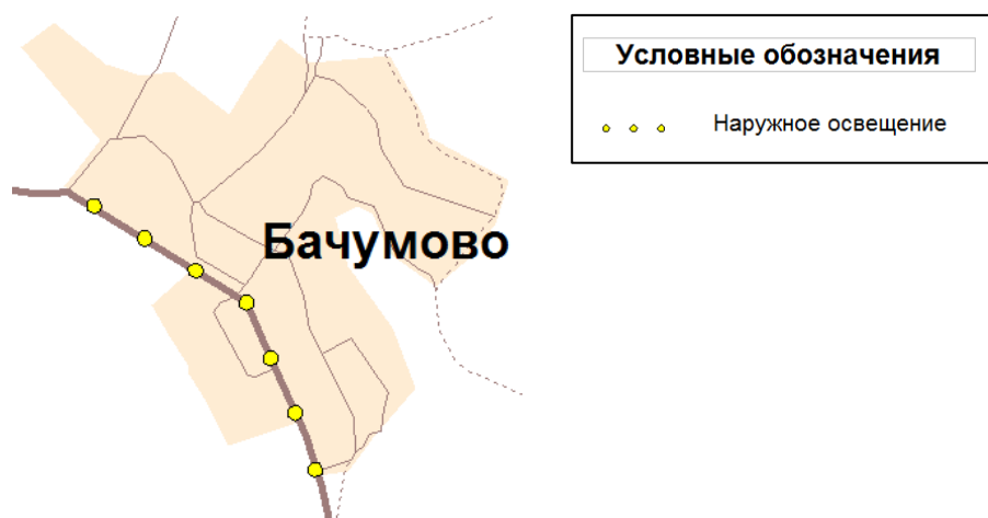
Рисунок 2.3.4.1. Мероприятия по организации дорожного движения