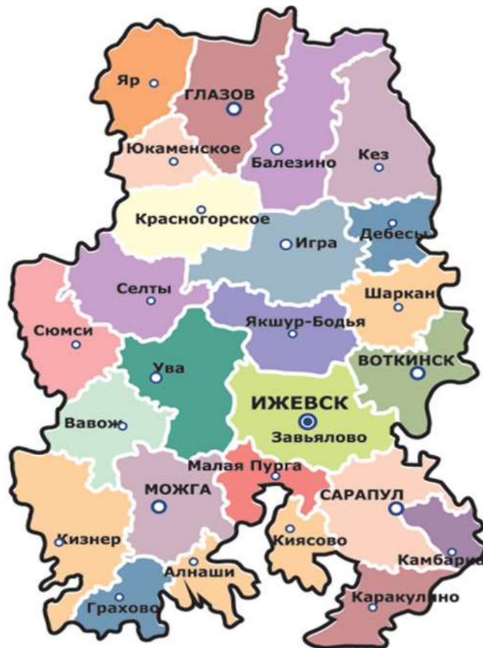
Рисунок 1 – Расположение Яркого района на карте Удмуртской Республики