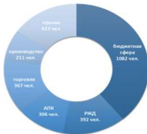
Рисунок 4 – Распределение работающего населения по отраслям экономики

Ведущими предприятиями производственного комплекса являются: