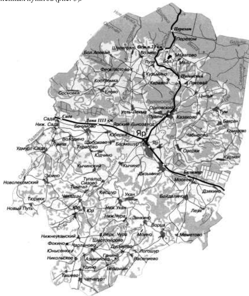
Рисунок 3 – Карта Ярского района Удмуртской Республики

Муниципальное образование «Муниципальный округ Ярский район Удмуртской Республики» состоит из 65 населенных пунктов (рис. 3).