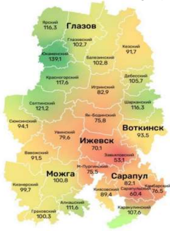
Рисунок 6 – Обеспеченность врачами